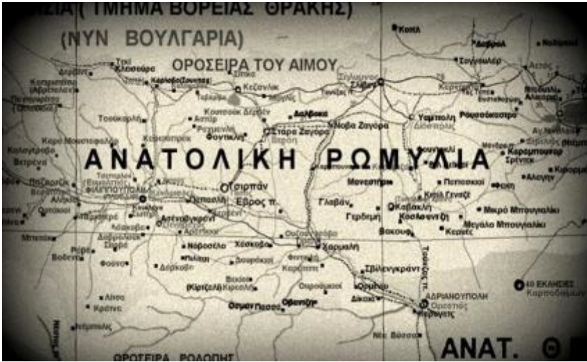
5. Χάρτης της Ανατολικής Ρωμυλίας