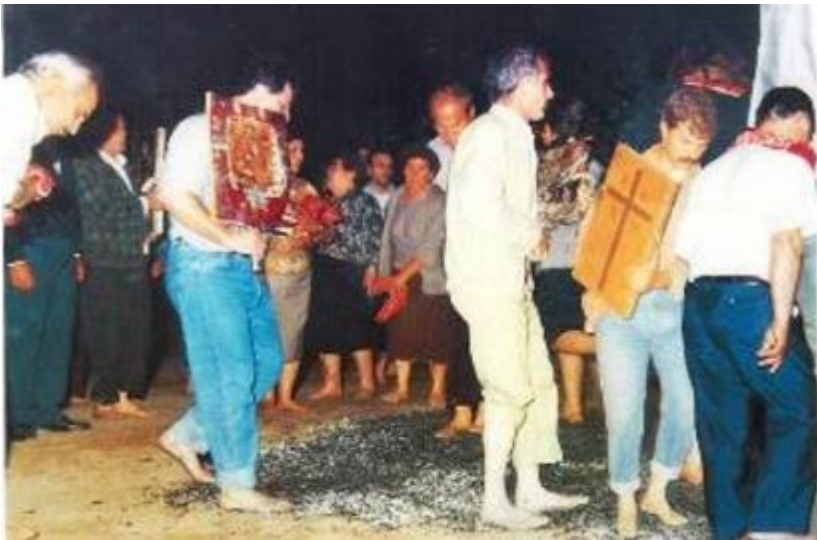
2. Αναστενάρια 1991. Πυροβασία Λαγκάδας Θεσσαλονίκης