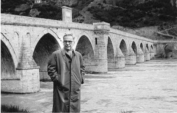
Ο συγγραφέας Ίβο Άντρις μπροστά στο γεφύρι του Δρίνου